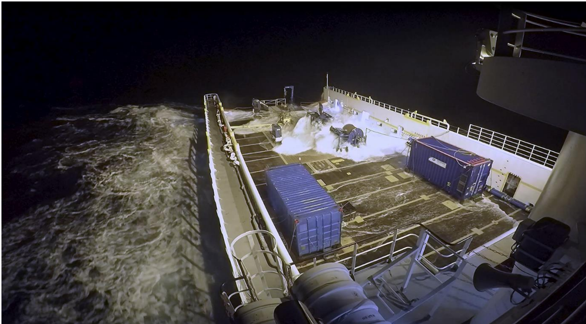
在南印度洋波涛汹涌中的凤凰行号。甲板上的两个蓝色集装箱为可移动式工作间，搜索团队在其中进行拖鱼设备的操作和维护。