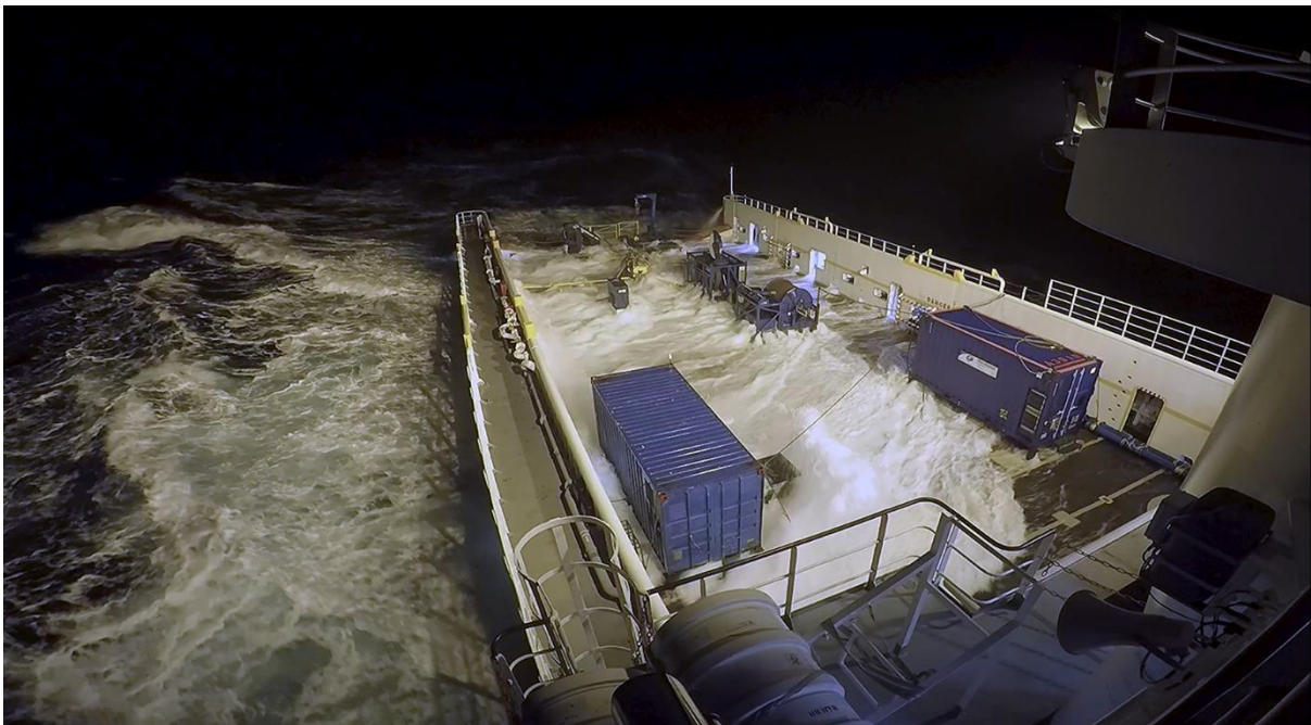
在南印度洋波涛汹涌中的凤凰行号。甲板上的两个蓝色集装箱为可移动式工作间，搜索团队在其中进行拖鱼设备的操作和维护。

目前搜索海区情况恶劣，海浪平均 6 米以上。未来数日，预计天气将进一步恶化，状况改善之前海浪最高将达 12 米。冬季期间，搜索行动将继续进行，但预期会有停顿。